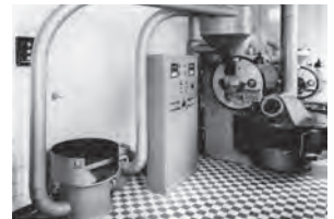
1962: Die Geschäfte nehmen zu, Kaffee wird zum alltäglichen Genussmittel 1965: Übernahme der Kaffeeröstereien Lorentz, Ahltag, Kadelbach und Frenzelt