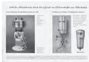
1955: August Münchhausen bringt einen Kaffeeautomaten auf den Markt für den »Kaffeegenuss in der Arbeitspause« 1958: Erweiterung und Modernisierung der Rösterei